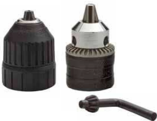
JA-GC-12 Główka do wiertarki 13 mm 1/2"