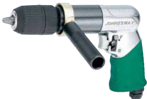
JAD-1027 Wiertarka pneumatyczna 13 mm 800 obr/min prawo-lewo, główka automatyczna