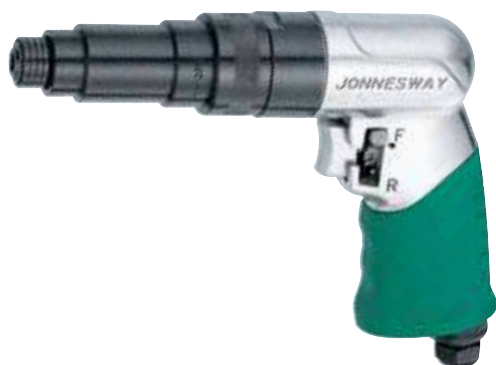
JAB-1018 Wkrętarka pneumatyczna 800 obr/min prawo-lewo